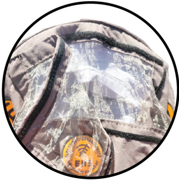
VISIÈRE 2e couche amovible