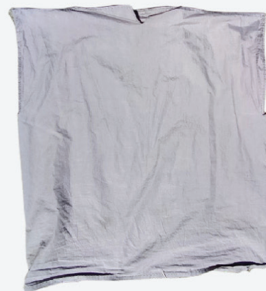
Tunique en 2e couche intérieure